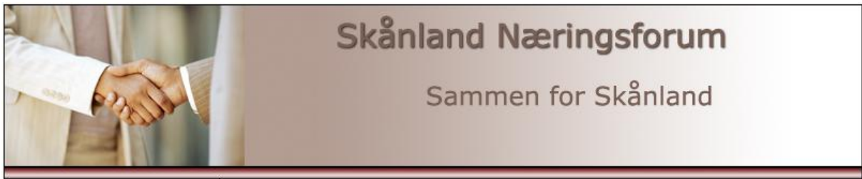
Bilde 1. Illustrasjonsfoto slik tavlen vil se ut.